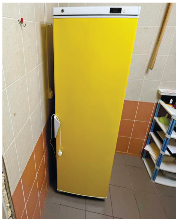
«Почти историческое фото – самый первый специализированный накопитель-холодильник для медотходов, установленный в Мурманской области»